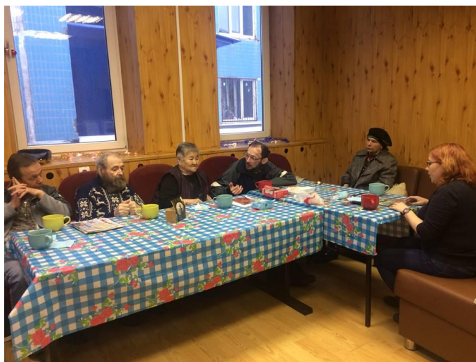
Рисунок 3: Встреча "Литературного клуба"