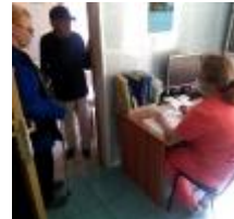
Nos collègues et partenaires du Centre d'adaptation de Lioublino offrent un accompagnement