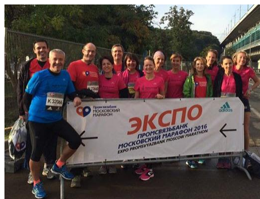
Les coureurs de l'équipe 2016 « Moskva Accueil pour le Samusocial »

➤ Session de sensibilisation sur l'aide sociale d'urgence et la grande exclusion : au cours 156 personnes ont suivi ces sessions d'une durée d'1h30 à 2h00. Elles ont eu lieu dans les bureaux du Samusocial et dans les locaux du Courrier de Russie à l'occasion ( Conférence au Courrier de Russie décembre 2016 )